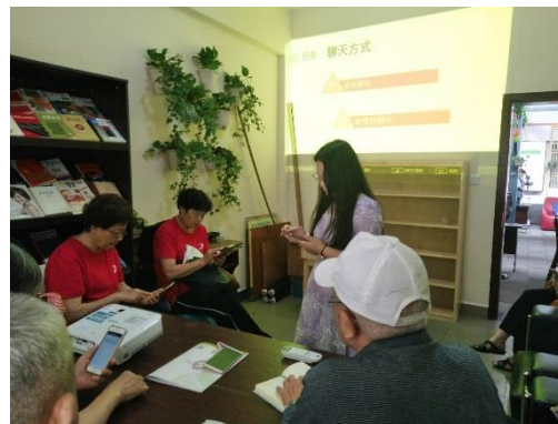
紫竹社区公益课程