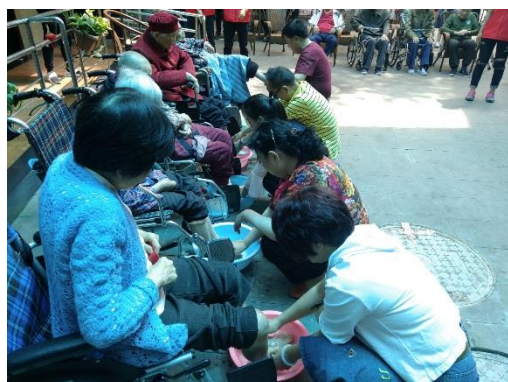
老人家属参与活动中