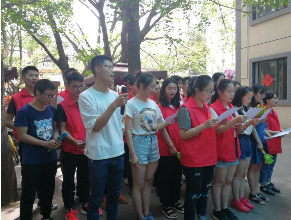
四川理工大学的志愿者们

带来了精彩的表演，并陪伴老人度过愉快的一天。此次活动，老人家属也参与其中，听母亲讲讲过去的事，给母亲洗洗脚，感受母亲的变化，感恩母爱的伟大。