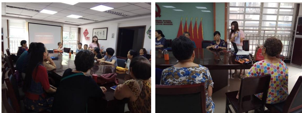
各院落居民前来参加动员会

2018年5月29日，由双林中横路社区主办、安康年养老服务中心承办的“365 党群共治 1+1+N”微创投动员大会顺利开展。此次公益创投项目范围包括弱势群体帮扶、院坝环境美化、居民茶话会、邻里互助参与等形式。每个院落以此项目方式竞标，针对各自的项目提交项目申报书，最终选取3个项目公益服务项目来开展具体活动。项目开展期间，安康年工作人员配合各院落开展，共同参与社区治理创新格局。